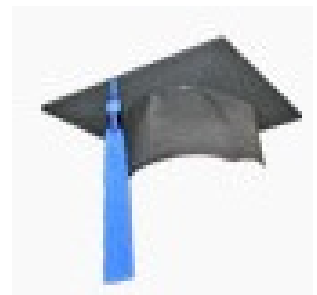
Μεταπτυχιακά προγράμματα στο Εξωτερικό

Βάση Δεδομένων ΠΜΣ στην Ισπανία http://www.tumaster.com/