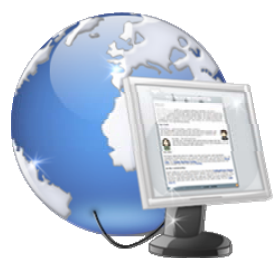
Μεταπτυχιακά προγράμματα στην Πληροφορική