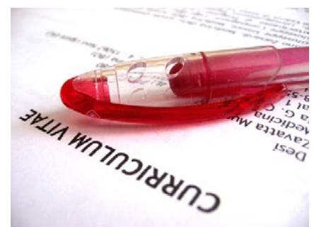
Βιογραφικό σημείωμα και Συνοδευτική επιστολή