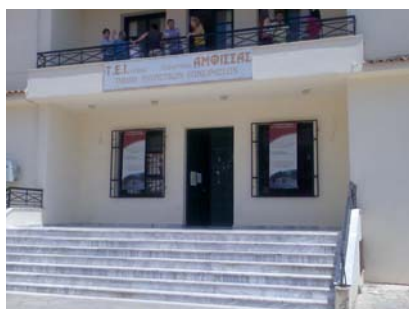
Τμήμα τουριστικών επιχειρήσεων του Παραρτήματος του ΤΕΙ Λαμίας στην Αμφισσα.