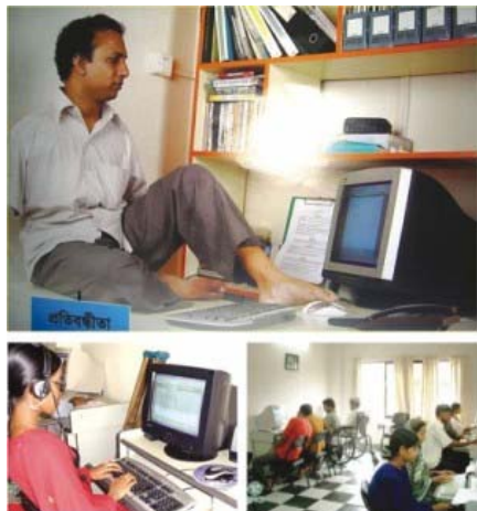
Άτομα με ειδικές ανάγκες

Τελικά πρέπει να γίνει συνείδηση όλων μας πως αν θέλουμε τα άτομα με αναπηρία να αναπτύξουν υγιείς προσωπικότητες, να ενταχθούν ομαλά στην