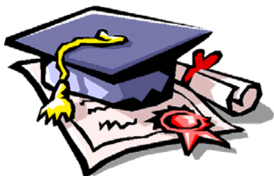
Μεταπτυχιακά προγράμματα στην Ελλάδα