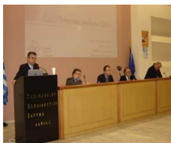
Ημερίδα «Μεταπτυχιακές Σπουδές στην Ελλάδα» που διοργάνωσε το Γραφείο Διασύνδεσης του Τ.Ε.Ι. Λαμίας στις 22 Μαρτίου 2006, με τη συμμετοχή της ΑΣΠΑΙΤΕ και του ΤΕΙ Πειραιά.