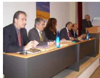
«Ολομέλεια Γραφείων Διασύνδεσης που διοργάνωσε το Τ.Ε.Ι. Θεσσαλονίκης στις 13-14 Δεκεμβρίου 2007»