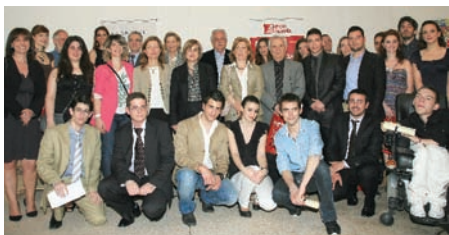
Τελετή απονομής των βραβείων: Μάιος 2011